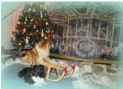
Penny, op slee, en Cilly wensen u fijne feestdagen en een goed en gezond 2016